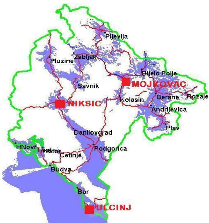
Mapu obradila: Andelija Kovačević

Zelena Agenda je pokretač lokalnog održivog razvoja. Na inicijativu nevladinih organizacija građani u grupama rade na izradi lokalnih strategija održivog razvoja, uključujući i akcioni plan za unapređenje i zaštitu lokalnih vrijednosti, kao što su prirodna bogatstva i istorijsko nasleđe.